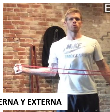
ROTACIÓN INTERNA Y EXTERNA